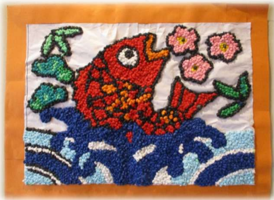
お花クラブの皆様作成です